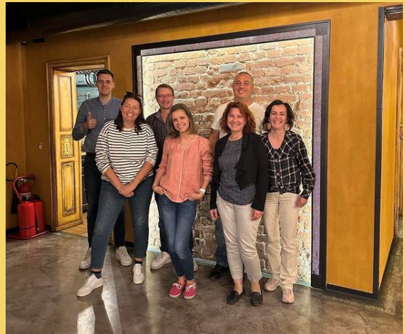
16.10.2023 г. - новият състав на Съвета на настоятелите след Общото събрание през септември 2023 г.