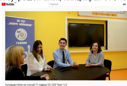
Сутрешен блок по случай 71 години 35. СЕУ Част 1/2

През ноември 2021 г. членове на Съвета на настоятелите участваха в заснемането на празничния сутрешен блок, иницииран от Ученическия съвет по повод патронния празник.