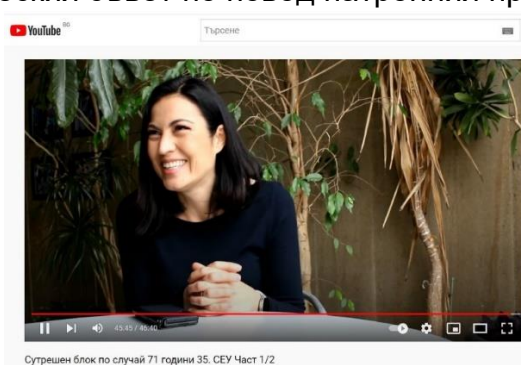
Сутрешен блок по случай 71 години 35. СЕУ Част 1/2