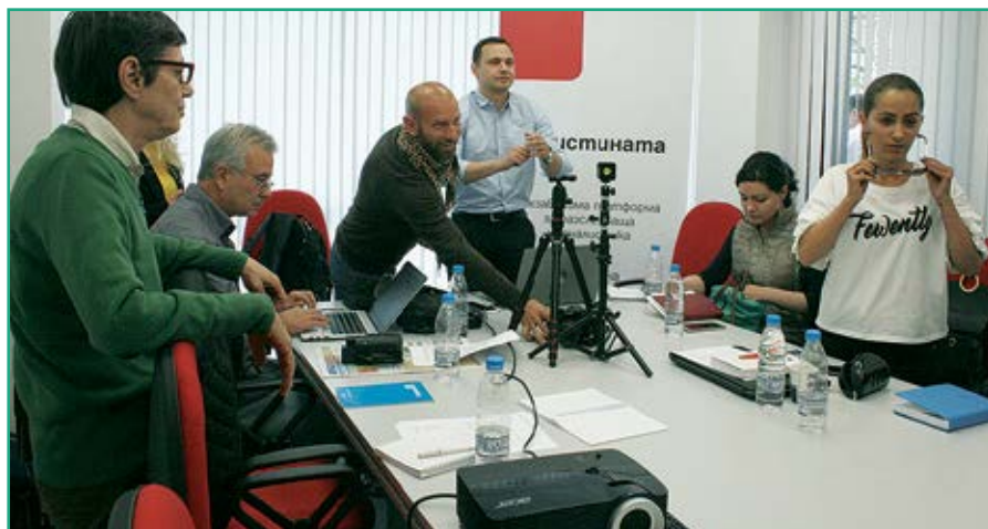
Обучение на екипа

Това тревожно състояние на регионалната журналистика мотивира Спас да създаде онлайн платформата „За истината“.