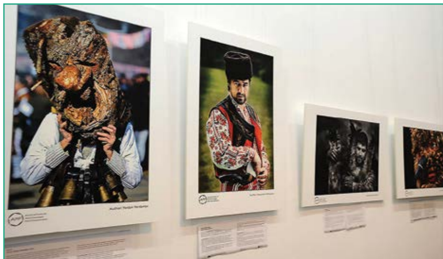
Изложбата „Древни традиции и обичаи от България“

Пожелавам си силно обединение на фотографската общност. Да се подкрепяме, да представяме качествената фотография и професионалните фотографии у нас и в чужбина. Да имаме възможности да показваме повече от своето творчество.