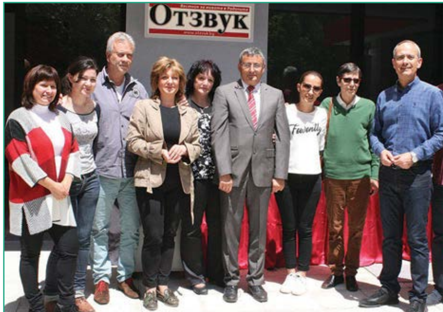
Екипът на „За истината“ на откриването на офиса на „Отзвук“ в Смолян през 2019 г.