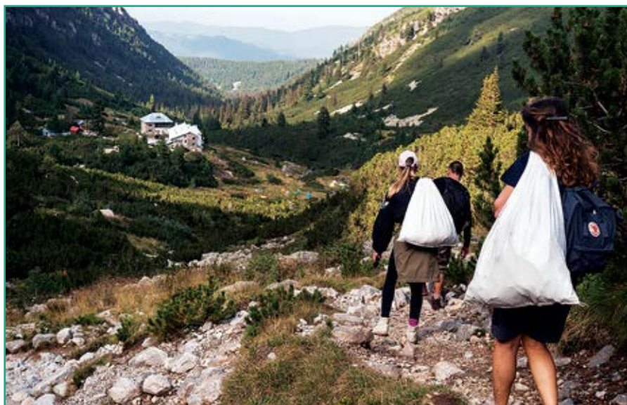
Доброволци слизат към хижа „Мальовица“ с чували с отпадъци