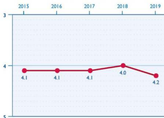
ОРГАНИЗАЦИОНЕН КАПАЦИТЕТ В БЪЛГАРИЯ

НПО са изправени пред сериозни затруднения по отношение на издръжката си и броят на активните организации е намалял. „Фонд активни граждани“ (предоставящ грантове със средства на Европейското икономическо пространство в България), например, посочва, че през 2019 г. е получил прикл. 25 процента по-малко предложения, отколкото при предходни покани за проектни предложения.