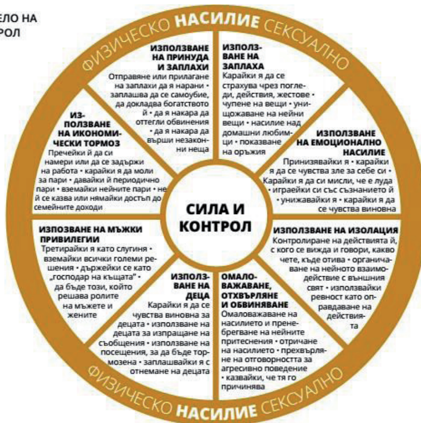
Фигура 1: КОЛЕЛО НА ВЛАСТ И КОНТРОЛ