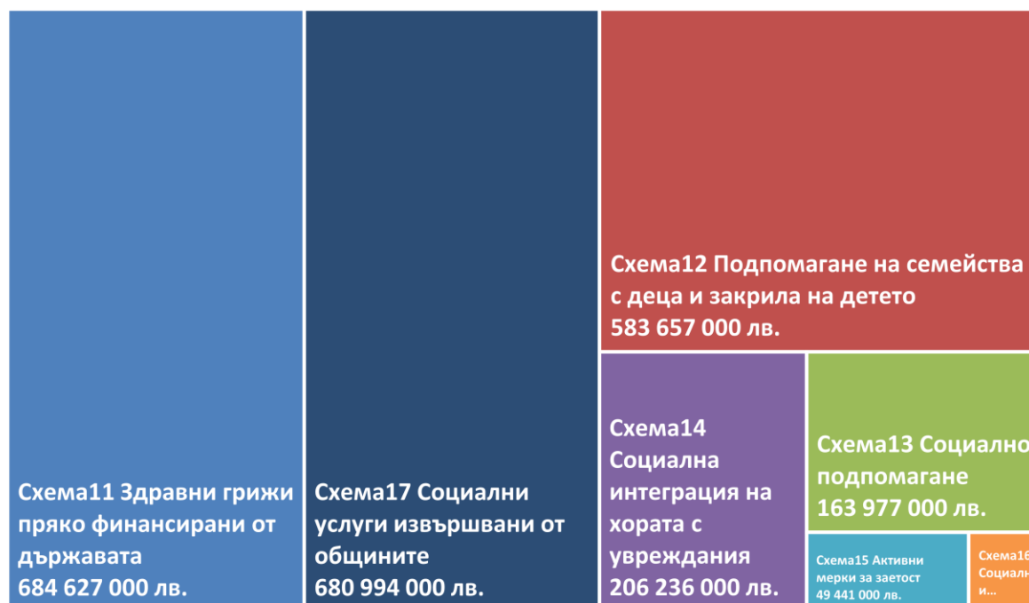
Графика 2: Разходи за социална защита в България, с изключение на социално-осигурителни фондове и плащания от работодатели (лв., 2018 г.)