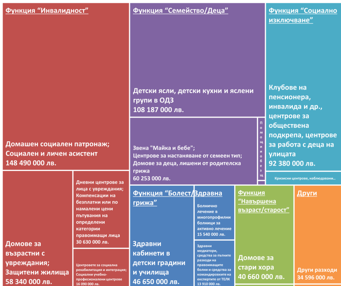
Графика 3: Разходи за социални услуги извършвани от общините в България (лв., 2018 г.)